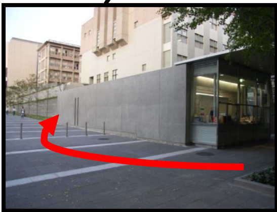
赤ルートは警備室の裏手にまわる。