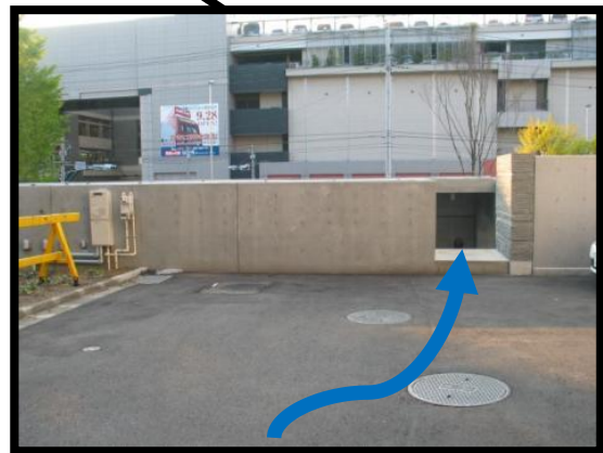
青ルートはこの階段を降りる。

入口の右側に I C カード読取装置がありますので、そこに I C カードをかざしてください。