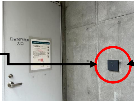
読取装置 I C カード